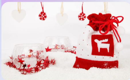
季节性和装饰性礼品